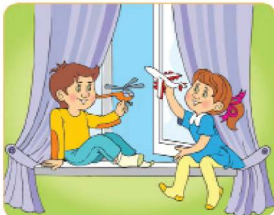
بازی در جاهای بلند و خطرناک

● به شکل‌ها نگاه کن و بگو هر کدام چه خطری را نشان می‌دهد.