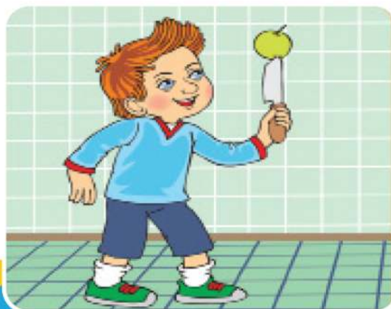
بازی با چاقو