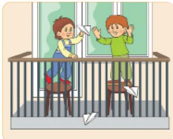
افتادن از بلندی