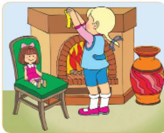
خشک کردن لباس روی بخاری